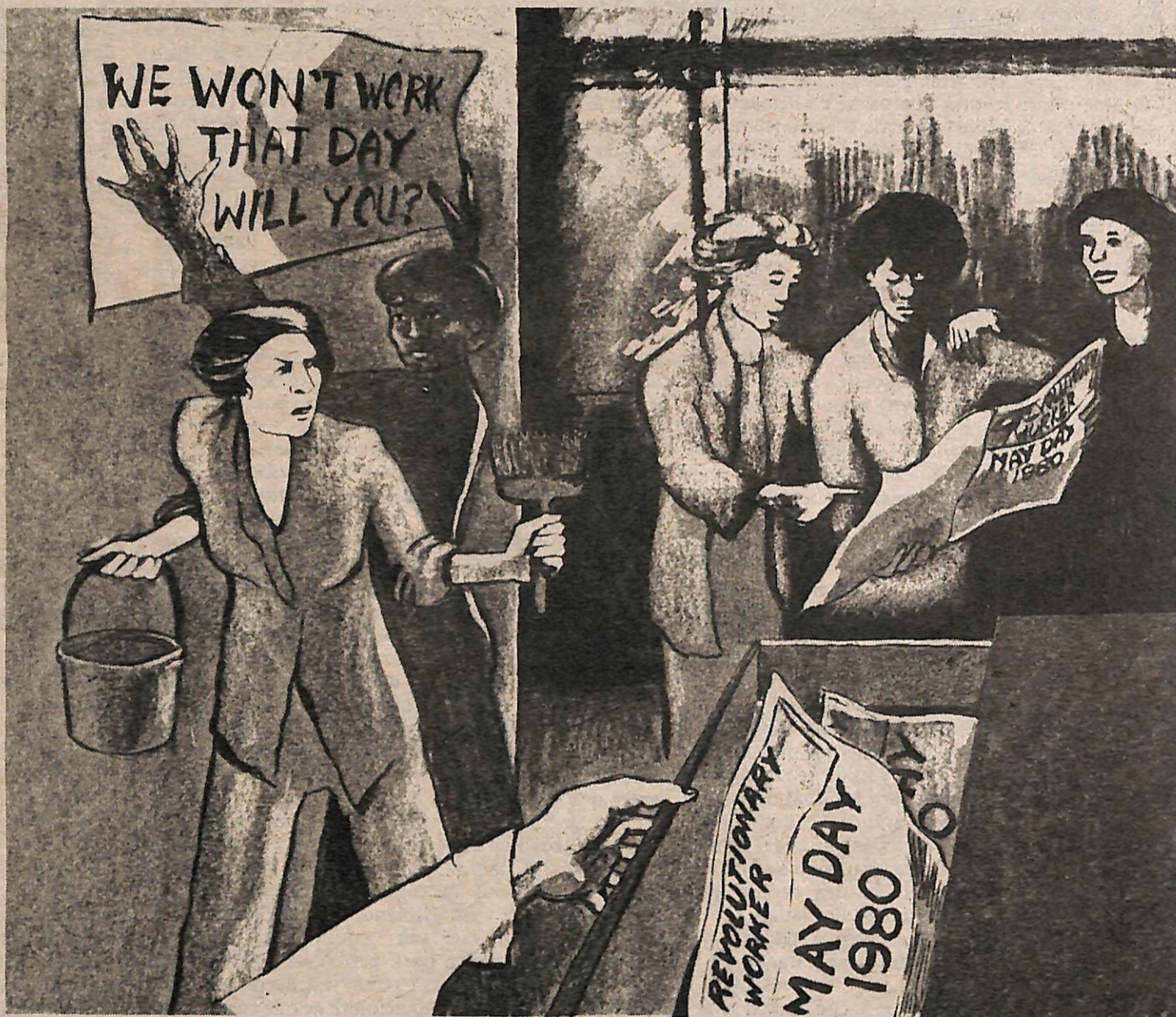
El OR recibió recientemente este dibujo. Fue inspirado por un artículo sobre una red del OR en una fábrica donde las obreras se pasaban el periódico de una a la otra dejando números del periódico en un cajón para que lo encontraran las obreras del próximo turno.

Las tropas invasoras de E.U. fueron obligadas a realizar una masiva busca de armas, puesto que el pueblo no las rindió. La furia del pueblo contra la invasión por los yanquis fue tan profunda que le cortaban el cabello y a veces las orejas a las prostitutas que entretenían a los soldados yanquis. Después de 17 meses, E.U. se sintió obligado a retirar sus tropas por temor de otra insurrección. □