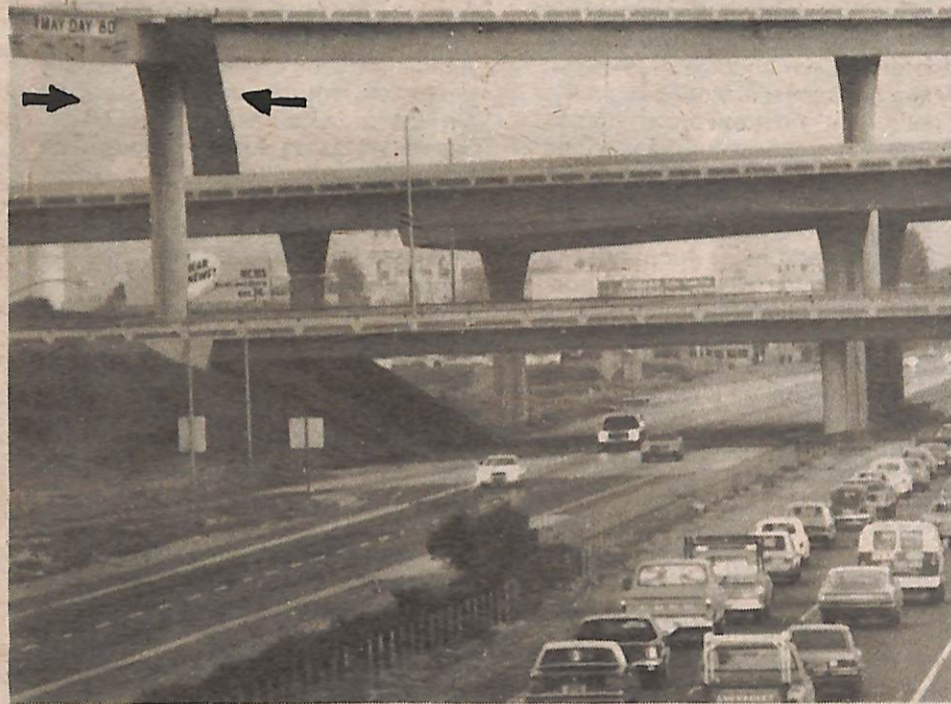
East Side de San José

Y la amenazada acción militar por parte de E.U., que los militantes estudiantes han advertido repetidamente causaría la muerte del personal de la embajada, ha puesto nerviosos a muchos de los rehenes y sus familias por lo que pueda estar planeando Carter, preguntándose si de veras Carter está tan "preocupado" por el personal de la embajada. Quizás le diga al pueblo E.U.—como se nos dijo muchos veces durante la guerra de Vietnam, que él tuvo que "matar a los rehenes a fin de salvarlos". □