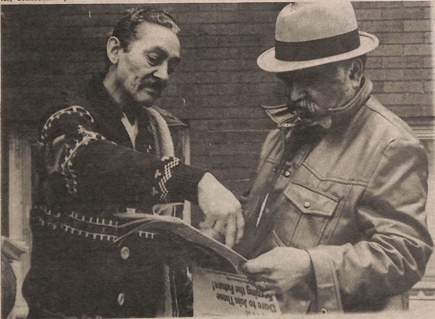
"Yo apoyo la independencia para Puerto Rico" dijo él (después de comprar un periódico y luego vender dos a sus amigos). "Pero sólo para Puerto Rico no es suficiente—como mis amigos allí, mexicanos, hay mucha gente con los mismos problemas".

Pero las noticias se difundieron y cuando las Brigadistas salían, pasaron a unas mujeres en una línea que iban a ver una película por el Domingo Santo. Todas sonrieron, y una levantó el puño y dijo en voz baja, "Primero de Mayo". Y cuando pasaron por el cuarto de recreación, todas las mujeres allí levantaron el puños, con excepción de una—dio la seña de aprobación con el pulgar. Una vez más, en la cárcel así como en Watts, se difundía la conspiración del Primero de mayo.