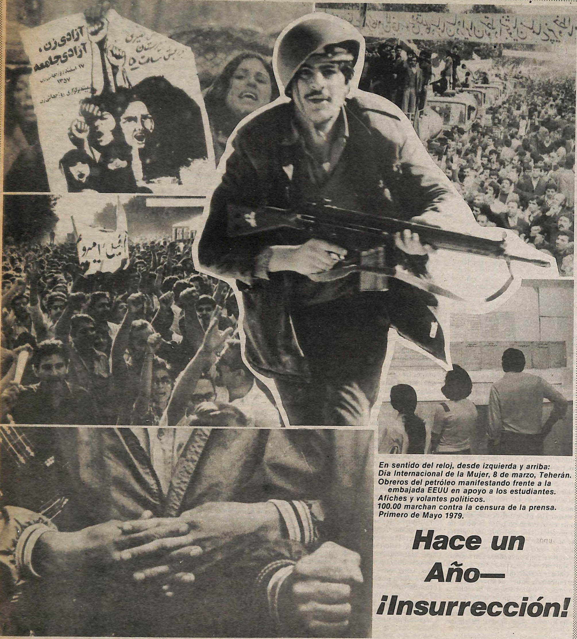
En sentido del reloj, desde izquierda y arriba: Día Internacional de la Mujer, 8 de marzo, Teherán. Obreros del petróleo manifestando frente a la embajada EEUU en apoyo a los estudiantes. Afiches y volantes políticos. 100.00 marchan contra la censura de la prensa. Primero de Mayo 1979.