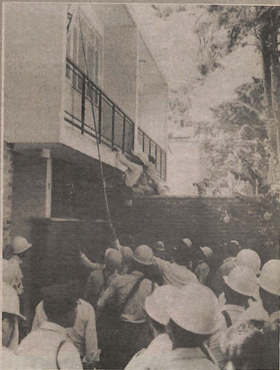
Policía comienza asalto contra embajada española en Ciudad de Guatemala.

La policía guatemalteca quemó vivos a 32 campesinos indígenas, inclusive a mujeres y niños, así como a una monja, a dos ex funcionarios del gobierno guatemalteco y a cinco empleados de la embajada española en Ciudad de Guatemala, el 31 de enero.