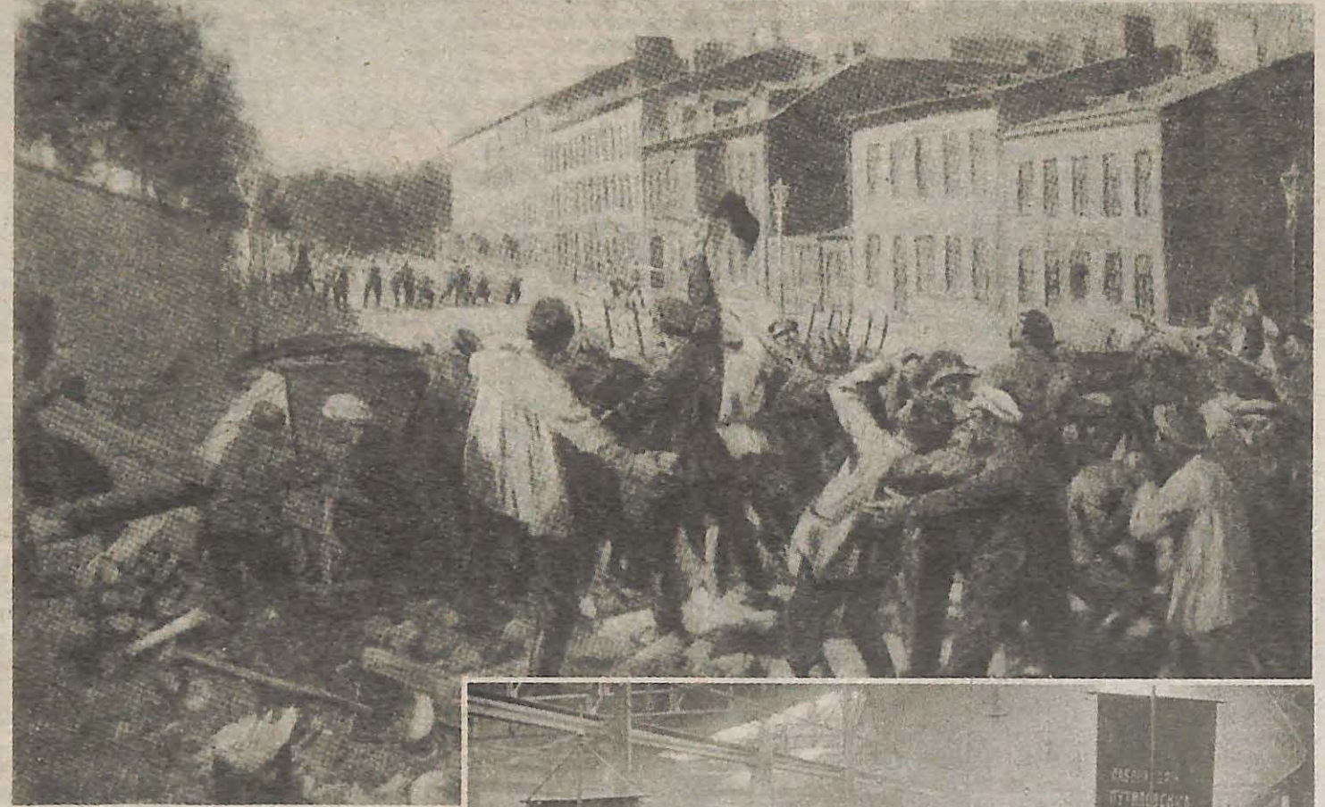
El Primero de Mayo 1912 jugó un rol crítico en preparar a la clase obrera rusa, por lo tanto entraron al período de la guerra imperialista con la bandera revolucionaria en alto.