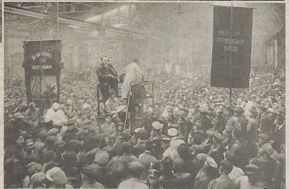
Abajo: Reunión Popular en la fábrica de Putilov durante la Revolución.

resueltos a luchar sólo por guantes y delantales."