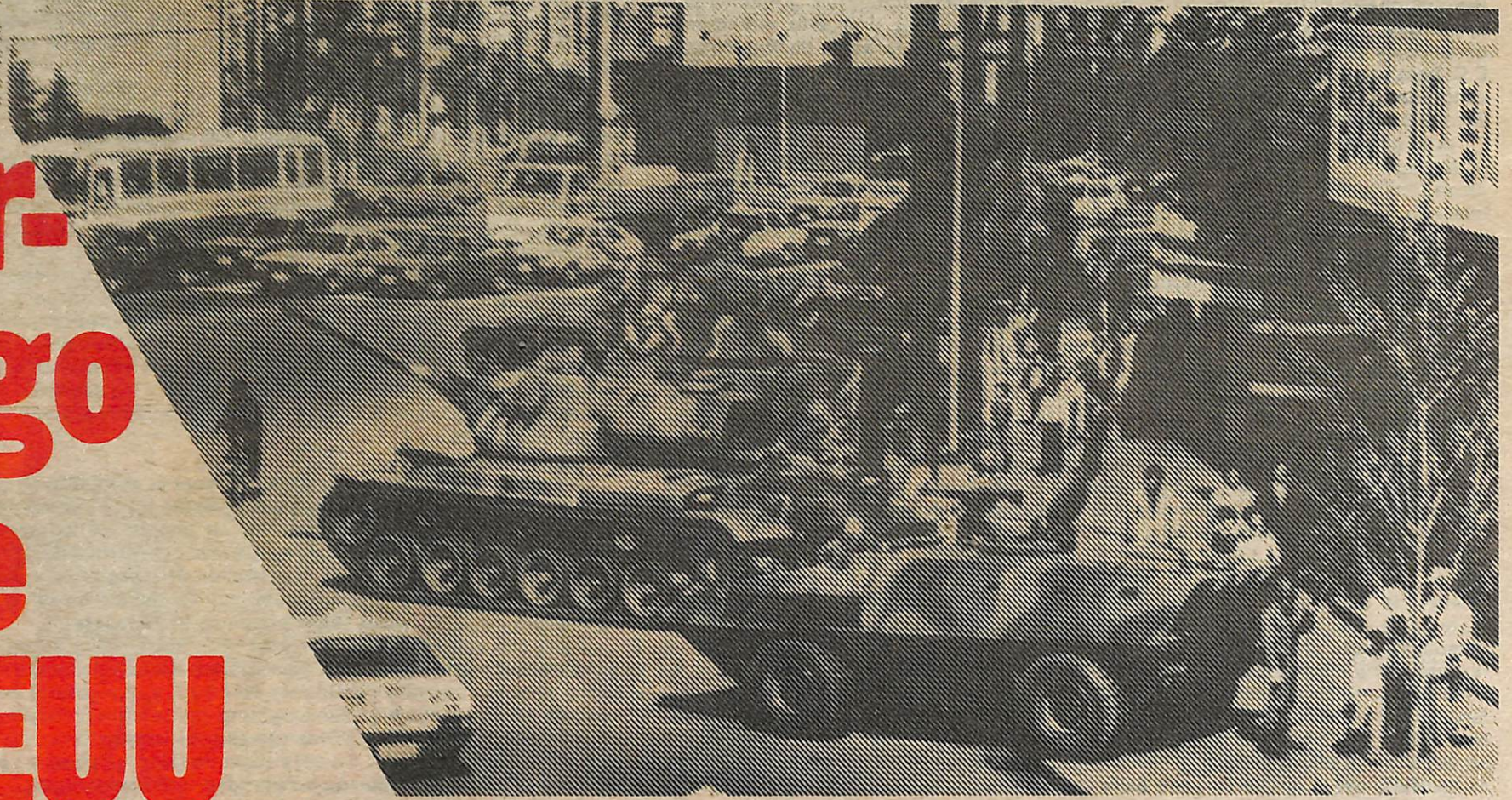
Las manifestaciones más grandes en casi 20 años sacudieron a Corea del Sur durante la semana anterior al oportuno asesinato de Park. Como respuesta, Park movilizó a su ejército, equipado por EEUU, para defender los edificios del gobierno.