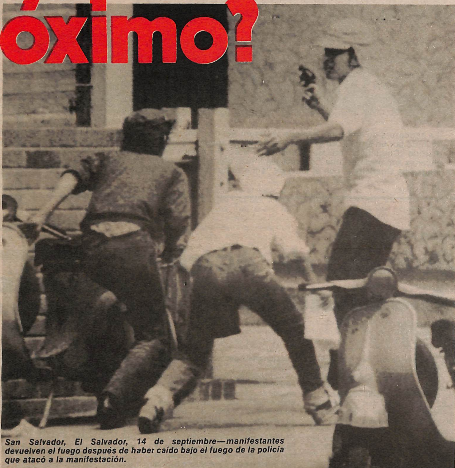
San Salvador, El Salvador, 14 de septiembre—manifestantes devuelven el fuego después de haber caído bajo el fuego de la policía que atacó a la manifestación.