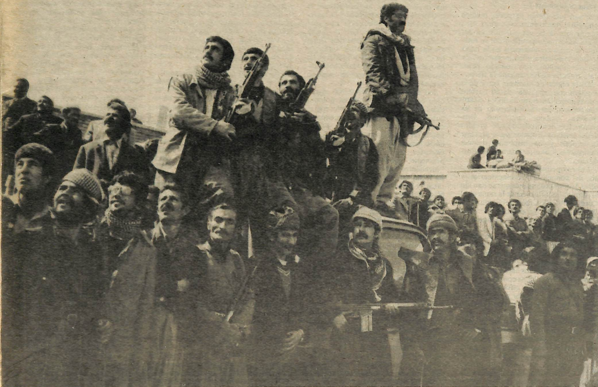
(Arriba) Luchadores por liberación curdos de guardia en contra de los aviones del gobierno durante la batalla por Sanandaj, capital de Curdistán—18-22 de marzo 1979.

“No piensen que sólo nos interesamos por los problemas de este pueblo”, dijo él. “No. Nos interesa la lucha de los pueblos en todos los países del mundo en contra del imperialismo”.