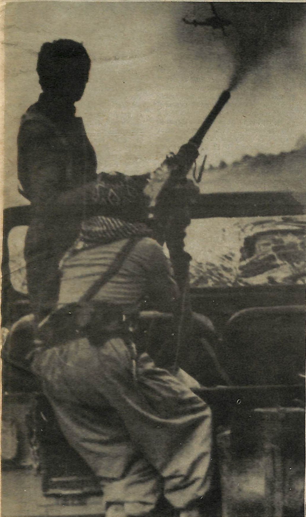
Revolucionario curdo abre fuego contra helicóptero del gobierno.