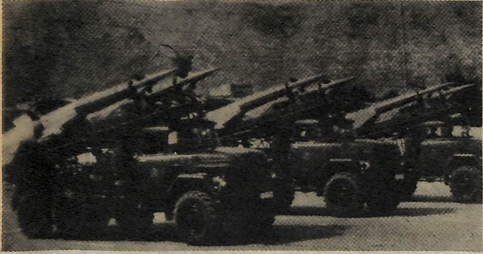
Cohetes soviéticos en un desfile en Kabul, la capital de Afganistán.