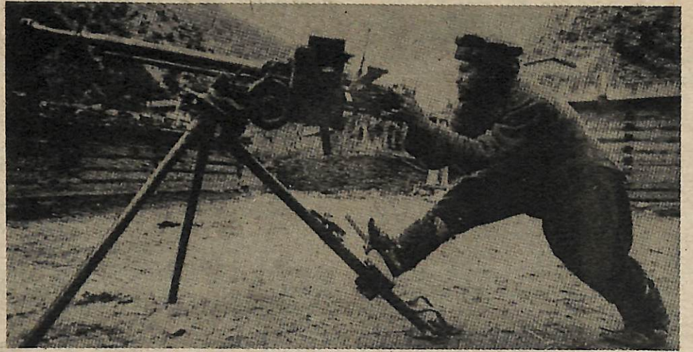
Guerrillero afgano usando arma capturada de los soviéticos.