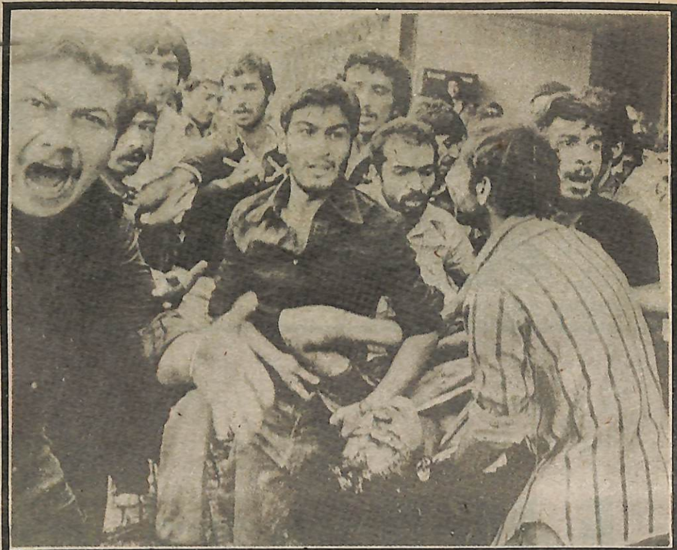
8 de septiembre, La Plaza de los Mártires, Tehrán—Viernes Negro. Iraníes cargan a un camarada caído después de que las tropas del Sha entrenadas y armadas por la CIA con armas estadounidenses, abrieron fuego contra manifestantes desarmados, matando a 10.000. El Congreso de los Estados Unidos no condenó este masacre, y la prensa estadounidense no lo mencionó.

Lo que verdaderamente les sorprende es quien está matando a quien. Asesinatos políticos, supresión sangri-