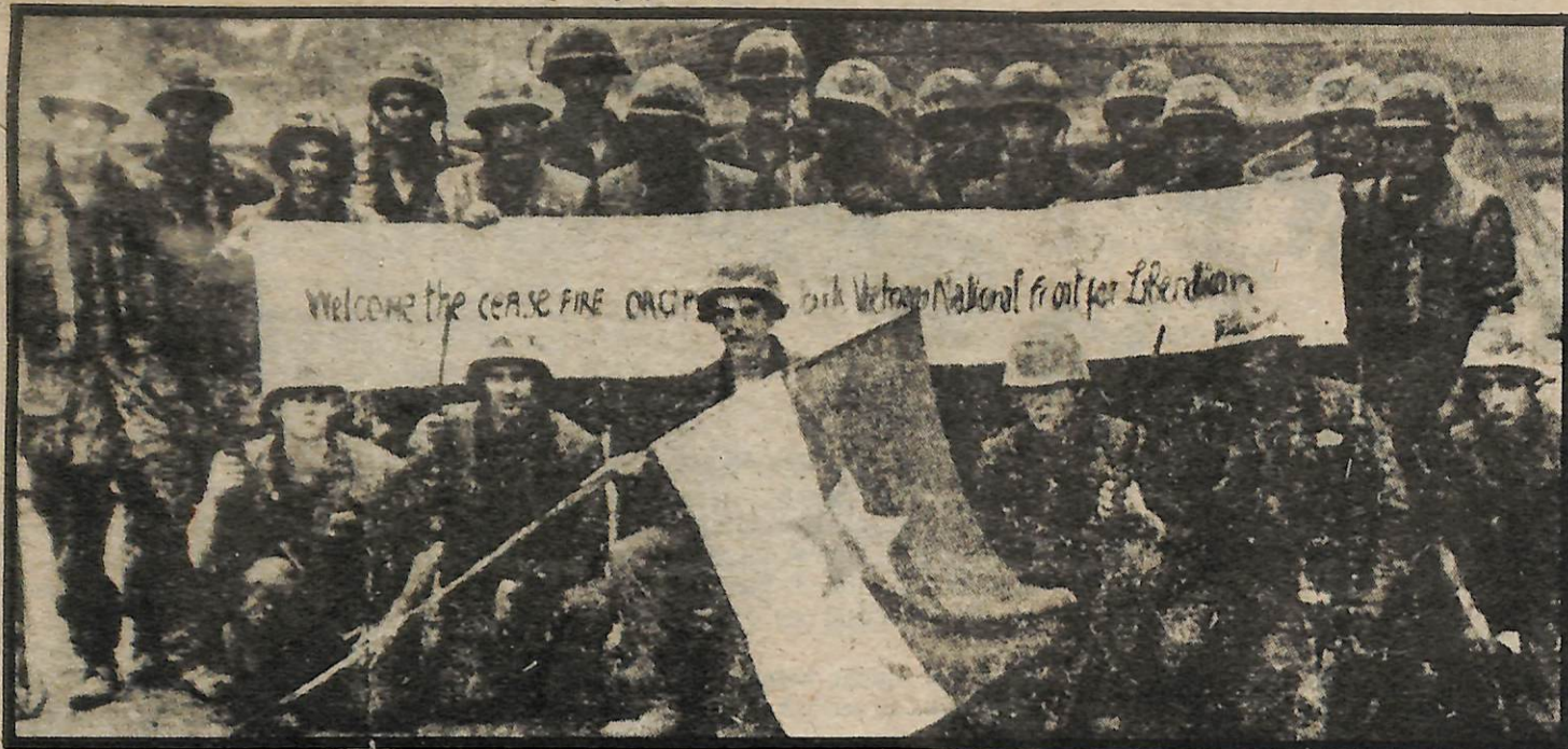
Estos soldados en servicio activo de la era de Vietnam llegaron a entender cual lado tenía razón y cual no. Con orgullo levantan la bandera "del enemigo," dan la bienvenida a la cesa de fuego e inminente victoria del Frente de Liberación Nacional.