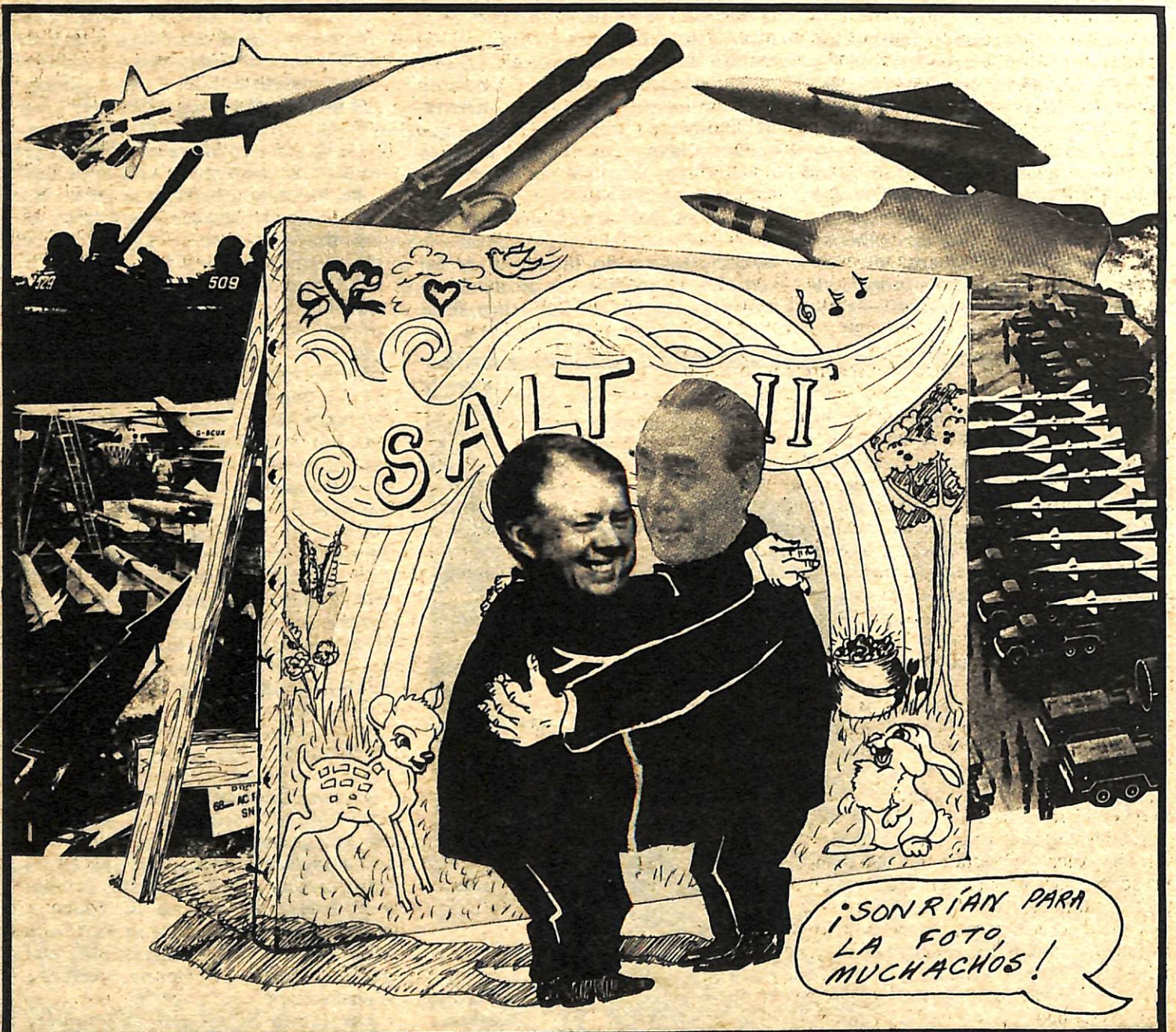
Conferencia SALT sobre Limitación de Armas.

del OBRERO REVOLUCIONARIO del Partido Comunista Revolucionario, EEUU