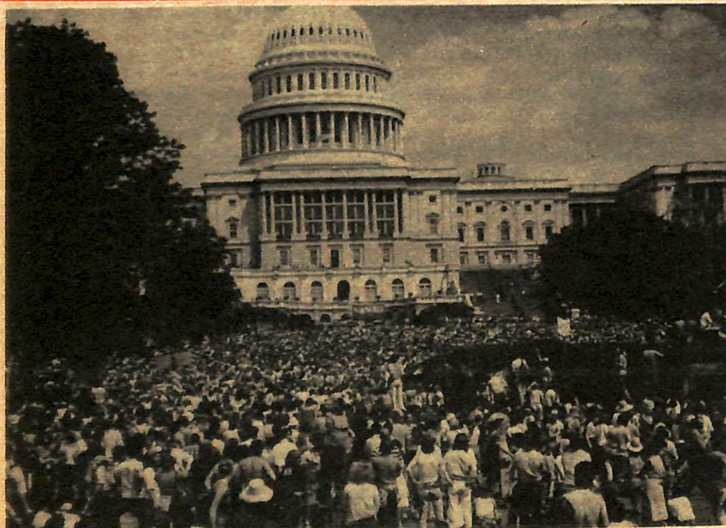
Anti-nuke demonstration, Washington D.C., May 6, 1979.