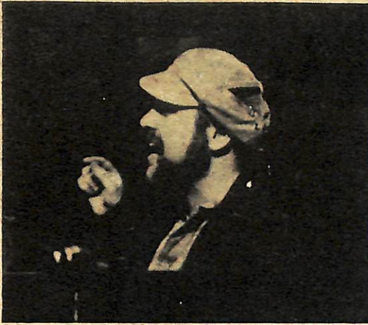
Selecciones del Discurso del Camarada Bob Avakian.

Y así como hicieron en Irán, la gente pasará de pequeños estallidos de resistencia, como ya están ocurriendo en este país, a rebeliones más masivas, a rebeliones de uno o dos días, hasta la lucha política más sostenida, huelgas de trabajadores, como hicieron en Irán, que se convirtieron en huelgas políticas, hasta