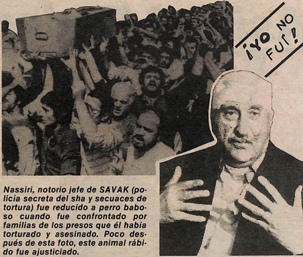
Nassiri, notorio jefe de SAVAK (policía secreta del sha y secuaces de tortura) fue reducido a perro baboso cuando fue confrontado por familias de los presos que él había torturado y asesinado. Poco después de esta foto, este animal rábido fue ajusticiado.

Después de 25 años de sostener y abastecer a la dictadura salvaje del sha con todo, desde aviones a chorro F-14 hasta instrumentos de tortura, el gobierno EEUU ahora está sermoneando piadosamente al pueblo iraní acerca del “proceso debido de la ley” y está preocupado por las “violaciones de los derechos” de sus anteriores asesinos profesionales. Desde su escondite en las Bahamas, el mismo sha recientemente dijo que estaba “horrorizado” de las ejecuciones de “iraníes cuyo sólo