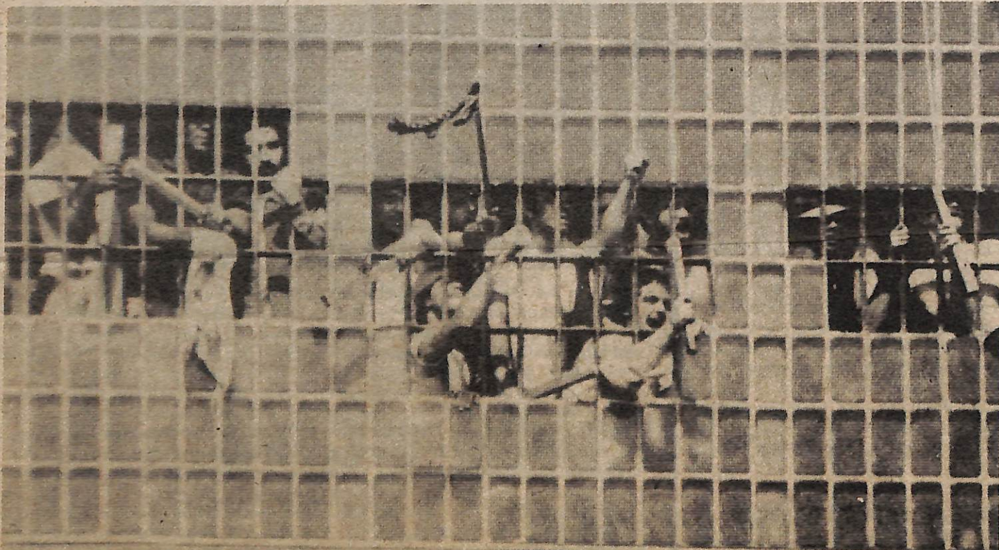
Rebelión en la prisión Tombs, Nueva York, 1970.