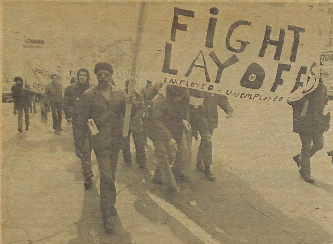
Obreros de auto marcharon en Nueva Jersey el febrero pasado como parte de una manifestación contra despidos y por trabajos.