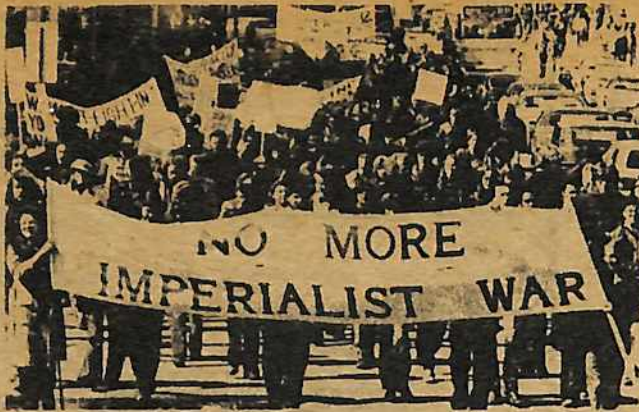
La gente de todos países no quieren nada que ver con los planes de guerra de las superpotencias. Arriba, la bandera en la marcha dice "No Más Guerras Imperialistas."

Muchos obreros se van llegando a ser más armados con un entendimiento de que hay que tomar la iniciativa en sus propias manos y mantenerla. Las batallas pequeñas actuales son el embrión de una lucha más extendida y conciente de la clase obrera que seguramente surgirá en oposición al empuje por ganancias de la burguesía. ■