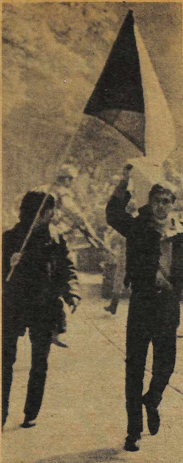
La invasión de Checoslovaquia en 1968 puso aún más a la vista la naturaleza imperialista de la Unión Soviética. En el foto arriba, jóvenes checoslovacos desafían los social-imperialistas.