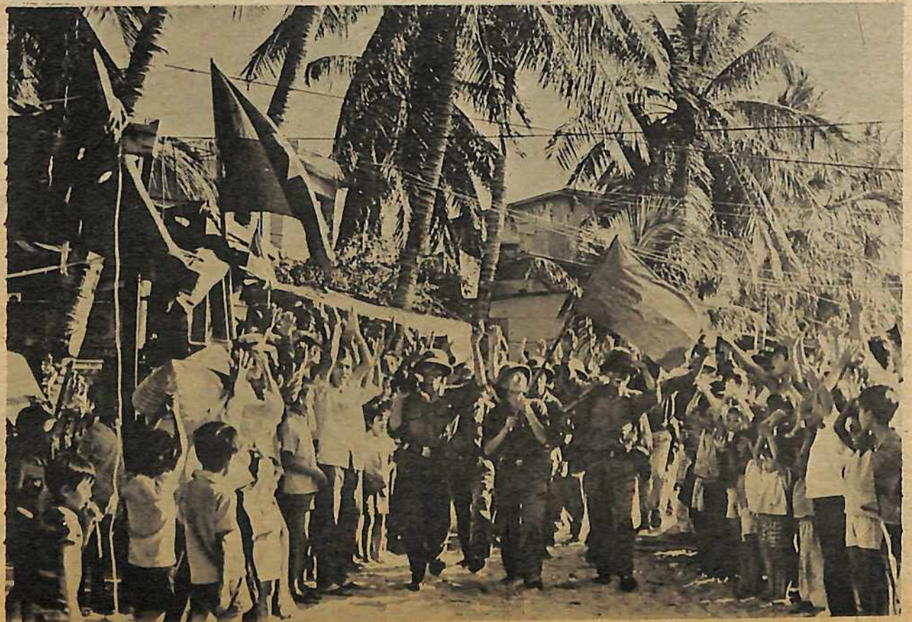
Las luchas revolucionarias y prolongadas de los pueblos indochinos han golpeado el imperialismo de EE.UU.