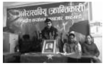
श्रद्धाञ्जली कार्यक्रम समेत सम्पन्न गयो ।