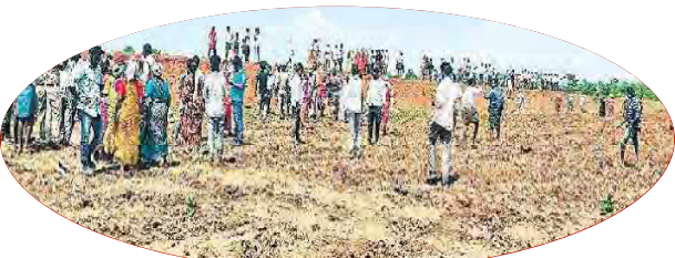
అటవీశాఖ అధికారులు నాటిన మొక్కలను ధ్వంసం చేసిన రైతులు

నలభై సంవత్సరాలుగా పోడు వ్యవసాయం చేసుకుంటున్న భూముల్లో మొక్కలు నాటడానికి వచ్చిన అటవీశాఖ అధికారులను రైతులు ఘెరావ్ చేశారు. తిరుమలగిరి మండలం ఎర్రచెరువు తండాలోని రైతులు నలభై ఏళ్లుగా 40 ఎకరాలలో పోడు వ్యవసాయం చేసుకుంటూ జీవిస్తున్నారు. ఫారెస్టు అధికారులు ఆ భూములకు పట్టాలు లేవని అది ఫారెస్టు భూమి అని మొక్కలు నాటేందుకు ప్రయత్నించడంతో