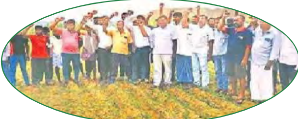
ఓసీ నష్ట ఆందోళన చేస్తున్న గ్రామస్థలు

కృష్ణ కాలనీ (భూపాలవల్లి): రాంనాయక్ తండాలోని ఓపెన్ కాస్టు-3 వద్ద గుర్రంపేట, పెద్దాపూర్, మాధవరావుపల్లి గ్రామస్థలు ఓసీ వసులు ఆపాలని ధర్మాకు దిగారు. ఓసీ-3లో చేపడుతున్న బాంబు బ్లాస్టింగ్ తో భూమి కడులుతూ నివాస గృహాలు