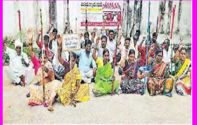
వనపర్తి జిల్లా పెద్ద మండ్లిలో సంబంధించిన చేస్తున్న పీఠాధిపతులు