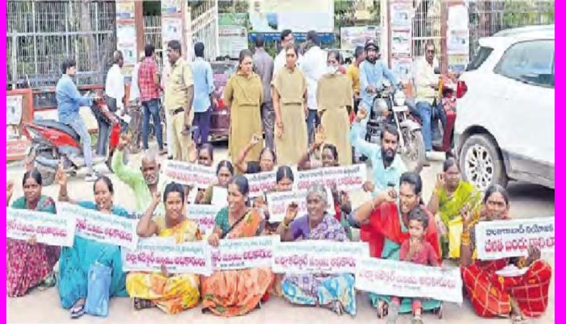
కలెక్టర్ ఎదుట ధర్మి చేస్తున్న దళితులు