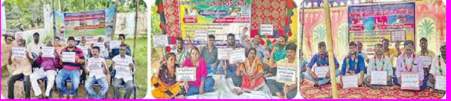
అశ్వారావుపేట, దుమ్ముగూడెం, అశ్వారావురంలో నిరసలు చేస్తున్న పీఠాధిపతులు