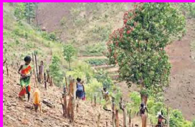
పోసు వ్యవసాయం చేసుకుంటున్న ఆదివాసీలు