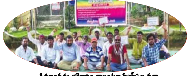
డిమాండ్లను ఆమోదించాలంటూ నిరసన ధర్మా

మేడ్చల్: వీఆర్ఎల డిమాండ్లను వెంటనే పరిష్కరించాలంటూ మేడ్చల్ మండల రెవెన్యూ కార్యాలయం ఎదుట ధర్మా చేశారు. వీఆర్ఎలకు పేస్కేట్ జీఓను వెంటనే విడుదల చేయాలని, ప్రమాషస్సు