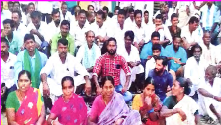
కలెక్టరేట్ ఎదుట నిరసనలు చేస్తున్న రైతులు