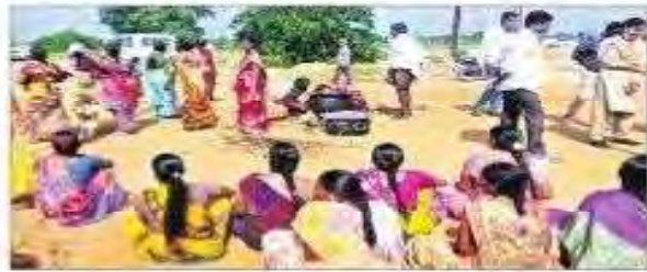
ఆందోళన చేస్తున్న కార్మికులు

జయశంకర్: గణపురం మండలంలోని ఓసీ-3 ఓపెన్ కాస్టులో పని చేస్తున్న బ్లాస్టింగ్ కార్మికులు, స్వీపర్లు జీఓ నంబర్ 22 ప్రకారం వేతనం అందించాలని డిమాండ్ చేస్తూ 4 తేదీ న ఆందోళన చేశారు. సింగరేణిలో పని చేస్తున్న కార్మికులకు పనికి తగ్గ వేతనం అందించాలన్న డిమాండ్ తో ఓసీ-3 ప్రధాన గేటు ఎదుట ఆందోళనకు దిగి