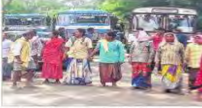
జాతీయ రహదారిపై రాస్తారోకో చేస్తున్న ఉపాధి కూలీలు

అస్సారావు పేట: సరివడ కూలీ ఇవ్వడం లేదని సెప్టెంబర్ 25 న ఉపాధి హామీ కూలీలు ఆందోళనకు దిగారు. మండల పరిధిలోని పేరాయిగూడెం గ్రామ పంచాయతీ పరిధిలో హరితహారం మొక్కలు నాటేందుకు గుంతలు తీయడం, పాదులు తీయడం, మొక్కలకు శ్రీగార్డులను ఏర్పాటు చేయడం, పిచ్చి మొక్కలను తొలగించడం చేస్తున్నారు. ప్రతి రోజు 50 మంది కూలీలు కొన్ని రోజులుగా ఈ పనులన్నీ చేస్తున్నారు. రోజు వారీగా ఈ కూలీలకు 250 రూ.