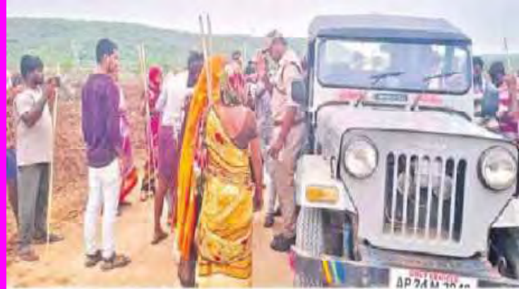
అటవీ అధికారుల వేహనలను అడ్డుకుంటున్న మహిళా రైతులు