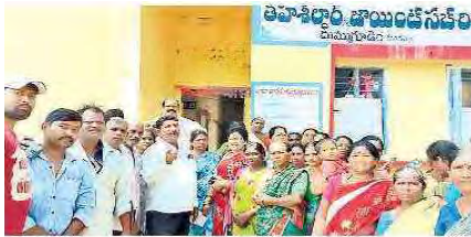
నిరసన వ్యక్తం చేస్తున్న బాధితులు

గోదావరి వరదలు కారణంగా సర్వం కోల్పోయిన బాధిత కుటుంబాలకు ప్రభుత్వం ఇప్పటి వరకు ఆర్థిక సహాయం 10,000 రూపాయలు మంజూరు చేయలేదు. బియ్యం, కందివప్పులు రెండు