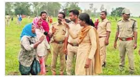
వాగొడ్డు గూడెం దగ్గర జరుపల్లాలు

90 గిరిజన కుటుంబాలు జీవిస్తున్నాయి. వీరు 225 ఎకరాల్లో 30 ఏళ్ల నుంచి పోడుసాగు