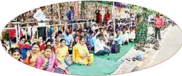
కలెక్టర్ ముందు సమ్మెలో పాల్గొన్న నిరసకులు

కరీంనగర్: వీఆర్ఎల సమస్యలు పరిష్కరించాలంటూ డిమాండ్ చేస్తూ కలెక్టరేట్ ఎదుట సమ్మె చేశారు. సీఎం ఇచ్చిన హామీ మేరకు