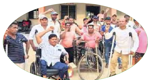
ధర్నా చేస్తున్న దివ్యాంగ విద్యార్థులు

వడ్డేపల్లి: సుబేదారిలోని రెడెక్రాస్ వెనకాల ఉన్న దివ్యాంగ బాలల హాస్టల్ స్థలాన్ని కట్టడం నుంచి కాపాడాలని డిమాండ్ చేస్తూ బాలల వసతి గృహం వద్ద ధర్నా చేశారు. అత్యంత విలువైన వసతి గృహ స్థలాన్ని కట్టడం కాజేయడానికి ప్రయత్నిస్తున్నారని