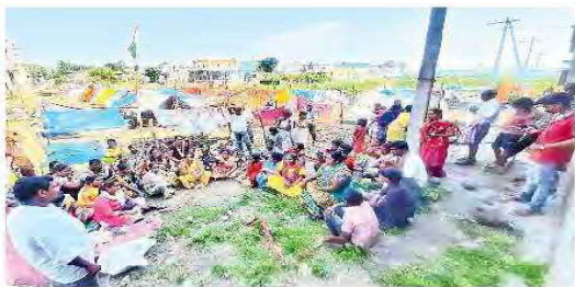
రెండు పడక గదుల ఇళ్ల వద్ద ఆవాసాలు ఏర్పాటు చేసిన పేదలు

భద్రాచలం లోని రాజీవ్ నగర్ కాలనీ శివారు మనుబోతుల చెరువు వద్ద ఖాళీగా ఉన్న ప్రభుత్వ స్థలాన్ని 24 తేదీన కొందరు ఆక్రమించారు. ఆ తరువాత రోజు ఉదయం తాత్కాలిక డేరాలు వేయడంతో ఇది సంచలనం అయింది.