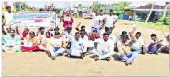
ఏటూరునాగారం: రాస్తారోకో చేస్తున్న వీఆర్ ఏల