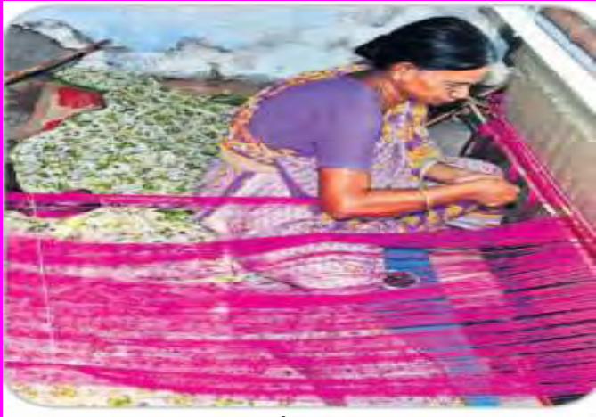
అమ్మలు నేస్తున్న ముఖాళా