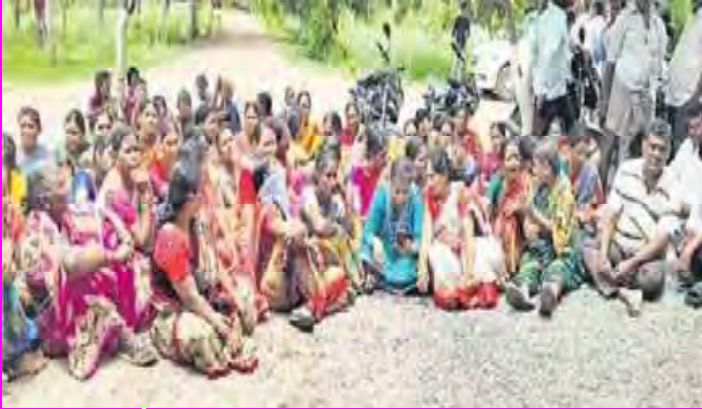
కలెక్టరేట్ అవరణలో ఆందోళన చేస్తున్న లడ్కావ్యర్ల నిర్వహితులు