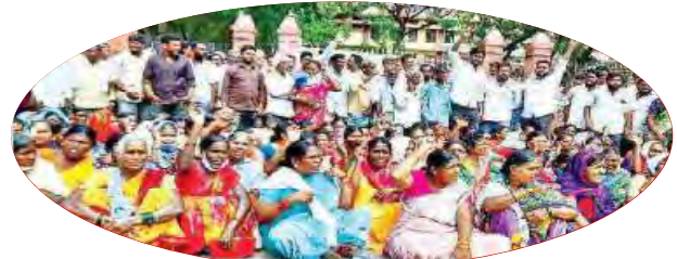
కలెక్టరేట్ ఎదుట ధర్నా చేస్తున్న నారాయణపూర్ రిజర్వాయర్ ముంపు బాధితులు

కరీంనగర్: పూర్తి ముంపు గ్రామాలుగా ప్రకటించి, పునరావాసం కల్పించాలని డిమాండ్ చేస్తూ గంగాధర మండలం నారాయణపూర్ ముంపు గ్రామస్థులు కలెక్టరేట్ ఎదుట భారీ ధర్నా చేశారు. నాలుగు గ్రామాల నుంచి ప్రజలు ట్రాక్టర్లపై వందల సంఖ్యలో జిల్లా కలెక్టరేట్ వద్ద గుమిగూడి నిరసన తెలియజేస్తూ 11 ఏళ్ల కిందట ఎల్లంపల్లి