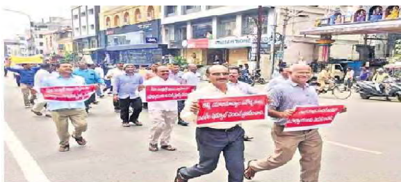
అసెంబ్లీని ముట్టడించేందుకు వెళ్తున్న భూపాలపల్లి జిల్లాకు చెందిన ఉపాధ్యాయులు

ములుగు: భూపాలపల్లి టౌన్, సెప్టెంబర్ 13 విద్యారంగ సమస్యలను పరిష్కరించాలని డిమాండ్ చేస్తూ అసెంబ్లీ ముట్టడి కార్యక్రమానికి భూపాలపల్లి నుండి వందలాది ఉపాధ్యాయులు తరలివెళ్లారు. 317 జీవో ద్వారా ఏర్పడిన ఇబ్బందులను తొలగించాలని, బలహీన వర్గాల పిల్లలకు నాణ్యమైన విద్య అందేలా చర్యలు చేపట్టాలని, ప్రమోషన్లు, బదిలీలు వెంటనే చేపట్టాలని డిమాండ్ చేశారు. విద్యార్థులకు పాఠ్యపుస్తకాలు, యూనిఫాంలు వెంటనే అందించాలని