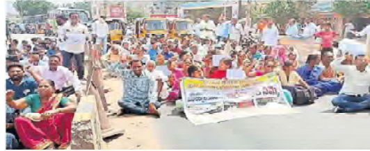
మంచుర్యాల ఓవర్ బ్రడ్డిపై రాస్తారోకో చేస్తున్న వీఆర్ ఏల

కొమరంభీం: అక్టోబర్ 8 న వీఆర్ ఏల మంచుర్యాల ఓవర్ బ్రడ్డి వద్ద ధర్నా రాస్తారోకో నిర్వహించారు. పోలీసులు వీఆర్ ఏల ధర్నాను చెదరగొట్టారు. దాంతో ర్యాలీగా ఐబీ చౌరస్తాకు వెళ్లి నిరసన చేపట్టారు.