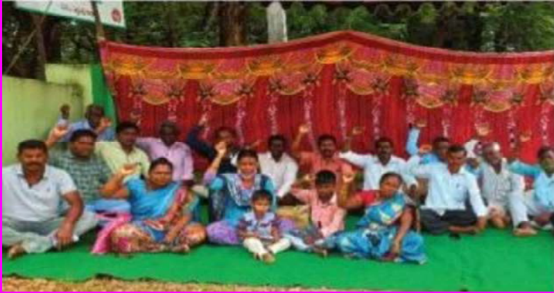
నిరసనకు సంబంధించిన చేస్తున్న పీఠాధిపతులు