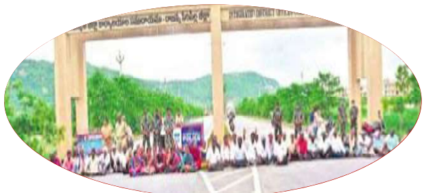
కలెక్టరేట్ ముందు ధర్నా చేస్తున్న రైతులు

ఖమ్మం: పత్తి క్వింటాలుకు రూ. 12 వేల మద్దతు ధరను నిర్ణయించి సీసీబి ద్వారా కేంద్ర ప్రభుత్వం కొనుగోలు చేయాలని తెలంగాణ రైతులు డిమాండ్ చేస్తూ కలెక్టరేట్ ఎదుట ఆందోళనకు దిగారు. వ్యవసాయ సీజన్‌లో అధిక వర్షాల కారణంగా పత్తిపంట ఎకరాకు 4-5 క్వింటాకు మాత్రమే దిగుబడులు వచ్చాయి. అంతర్జాతీయ మార్కెట్లో పత్తికి రూ. 12 వేలకుపైగా ధర ఉండగా కేంద్ర ప్రభుత్వం రూ. 6,380కి నిర్ణయించడం దుర్మార్గమని ఆగ్రహం వ్యక్తం చేశారు. ప్రస్తుతం ఆరు వేల ధర కూడా రైతులకు అందడం లేదని, ఎరువులు ఇతరత్ర ఖర్చులు పెరిగిపోయినా కేంద్ర ప్రభుత్వం మాత్రం పత్తికి మద్దతు ధరను