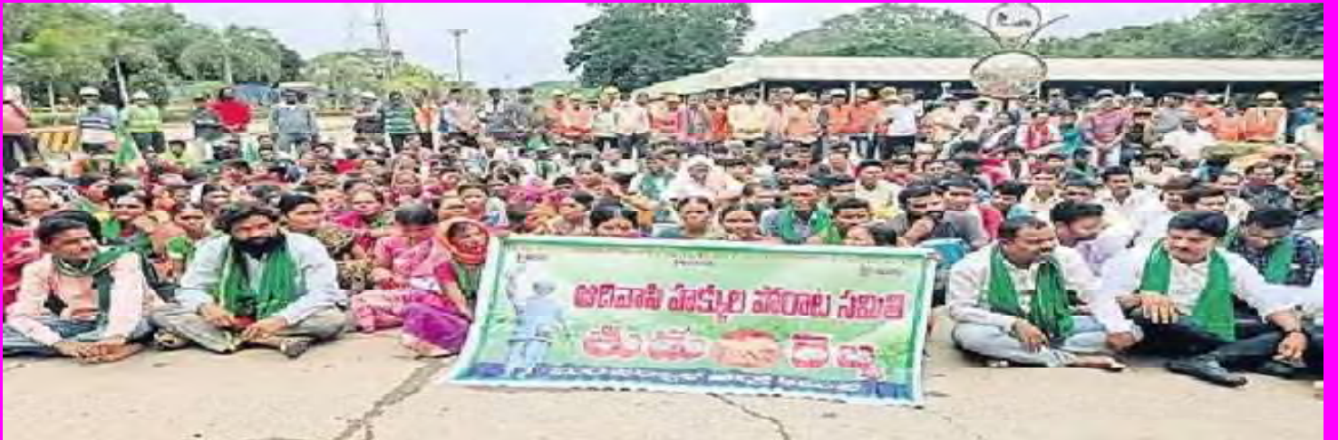
ఢిలయంట్ కంపెనీ గేటు ఎదుట ఆందోళనలు చేస్తున్న అధిపతులు