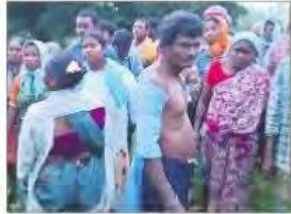
తోపులాటతో చరిగిన చొక్కాలతో గిరిజనులు

చేసుకుంటున్నాయి. ఫారెస్టు అధికారులు ఈ భూములు అటవీ శాఖవని రైతులని అడ్డుకుంటున్నారు. ఇరువర్గాల మధ్య వివాదం నెలకోవడంతో జాయింట్ సర్వే చేస్తామని, అప్పటి దాకా శాంతించాలని రెవెన్యూ అధికారులు సూచించారు. 8 సం. రాలు గడిచినా సర్వే చేయకపోవడంతో గిరిజనులు పలుమార్లు అధికారులకు విన్నవించారు. అయినా సర్వే చేపట్టలేదు. దీంతో ఎదురుచూసి విసిగిపోయిన గిరిజనులు వంటలు సాగు చేసుకుంటామంటూ ఆ భూముల్లోకి దిగారు. ఈ విషయం తెలిసి