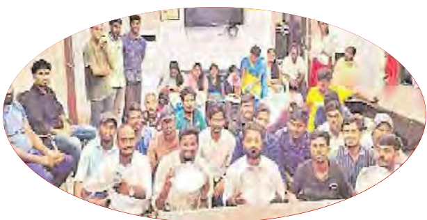
రిజిస్ట్రార్ చాంబర్లో భైతాయింపిన విద్యార్థులు

సూర్యాపేట: పెండింగ్ స్కాలర్షిప్, ఫీజురీయంబర్స్మెంట్ తదితర సమస్యలను పరిష్కరించాలని డిమాండ్ చేస్తూ సూర్యాపేట కలెక్టరేట్ను విద్యార్థినులు ముట్టడించారు. కలెక్టరేట్ ముట్టడిని పోలీసులు అడ్డుకోవడంతో ఉద్రిక్తత నెలకొంది. పోలీసులకు విద్యార్థులకు మధ్య తోపులాట జరిగింది. విద్యార్థుల నినాదాలతో కలెక్టరేట్ దద్దరింింది. మూడేండ్లుగా విద్యార్థులకు రూ. 3 వేలకోట్ల స్కాలర్షిప్,