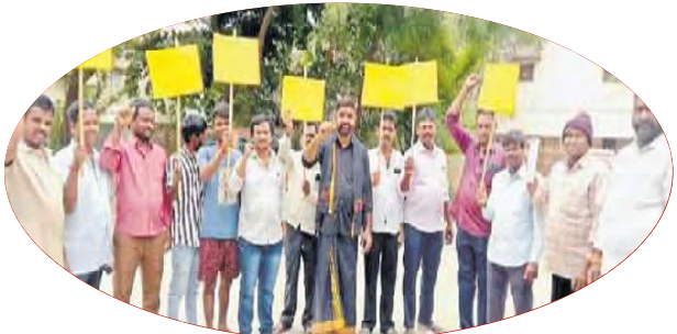
పరిష్కారం చూపిస్తామని హామీ ఇవ్వడంతో అక్కడ నుండి తరలి వెళ్లారు.

ఈ తాత్కాలిక గుడారాలను తొలగించడానికి గ్రామ పంచాయతీ తరఫున ట్రాక్టర్లలో సిబ్బంది వచ్చినప్పటికీ స్పష్టమైన హామీ ఇస్తేనే ఇక్కడ నుండి కదులుతామని తెగేసి చెప్పారు. తాసీల్దార్ శ్రీనివాస్ యాదవ్ ఆందోళనకారులతో మాట్లాడి దరఖాస్తులు అందిస్తే తగిన