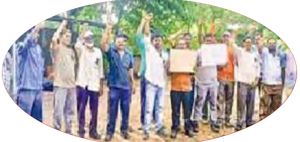
కాంట్రాక్టు కార్మికుల ధర్నా

రుద్రంపూర్: సింగరేణిలో పని చేస్తున్న కాంట్రాక్టు కార్మికులకు కనీస వేతన చట్టాన్ని అమలు చేయాలని సింగరేణి కాంట్రాక్టు కార్మికులు