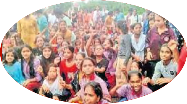
నర్సూల్ తటస్టూ రాస్తారోకో చేస్తున్న విద్యార్థినులు

పరిష్కరించాలని డిమాండ్ చేస్తూ రాస్తారోకో నిర్వహించారు. ఈ విషయాన్ని ప్రిన్సిపల్ వద్దకు తీసుకపోతే టీసీ ఇచ్చి పంపుతామని బెదిరిస్తున్నారని ఆరోపించారు. వర్షం వచ్చినప్పుడు కిటికీలలో నుండి