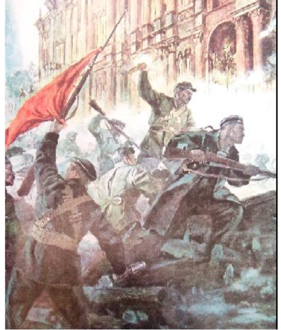
వింటర్ వ్యాల్స్ ముట్టడి

అక్టోబర్ 25వ తేదీన (నవంబర్ 7) బోల్షివిక్కులు "రష్యన్ పౌరులకు విజ్ఞప్తి" నొకదానిని ప్రకటించాడు. అందులో బూర్జువా తాత్కాలిక ప్రభుత్వం కూలద్రోయబడిందనీ రాజ్యంగ అధికారం సోవియట్ల హస్తగతమయిందనీ తెలియజేశారు.