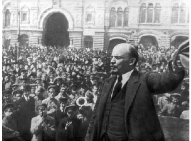
బోల్షివిక్ విప్లవం తర్వాత కార్మికులను ఉద్దేశించి రెడ్ స్పెర్లో ప్రసంగిస్తున్న కామ్రేడ్ లెన్-అక్టోబర్ 26, 1917

కార్మికవర్గ నాయకత్వాన సాధించబడిన అక్టోబర్ విప్లవం బూర్జువా డెమోక్రటిక్ విప్లవాన్ని సంపూర్ణంగా సాధించిందని లెనిన్ చెబుతారు. అంటే ఈ విప్లవం రష్యాలో మధ్యయుగాల అవశేషాలను, అర్ధబానిస వ్యవస్థను, పూర్వదలిజాన్ని పూర్తిగా నిర్మూలిస్తుంది. అయితే బూర్జువా డెమోక్రటిక్ విప్లవాన్ని సంపూర్ణంగావించడం అన్న కర్తవ్యం కార్మికవర్గ సోషలిస్టు విప్లవ ఉప ఉత్పత్తి సాధించబడింది. నూతన తరహా ప్రజాస్వామ్యం, కార్మికవర్గ నియంతృత్వం అంటే కార్మికవర్గ ప్రజాస్వామ్యం ఆవిర్భవించడాన్ని సోవియట్ వ్యవస్థను సూచిస్తుంది. ప్రపంచ చరిత్రలో నూతన యుగానికి, నూతన వర్గ పాలనకు నాంది పలికిందని లెనిన్ చెబుతారు.