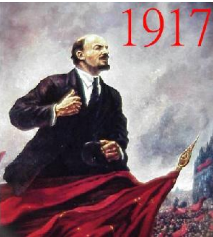
మహాసాధ్యాయుడు కామ్రేడ్ లెనిన్

1912 ఏప్రిల్ 4వ తేదీన సైబీరియాలోని లేనా బంగారు గనులలో సమ్మె జరుగుతున్నప్పుడు జారు ప్రభుత్వ పోలీసు సైన్యాధికారి ఆజ్ఞననుసరించి కాల్పులు జరిగాయి. ఇందులో చనిపోయినవారూ, గాయపడినవారూ అయిదువందల మంది. యజమానులతో సంప్రదించేందుకు శాంతియుతంగా పోతున్న నిరాయుధులైన లేనా గని పనివారలపై తుపాకులు పేల్చటం యావత్తు దేశాన్ని కదల్చివేసింది. గని పనివారల ఆర్థిక సమ్మెను