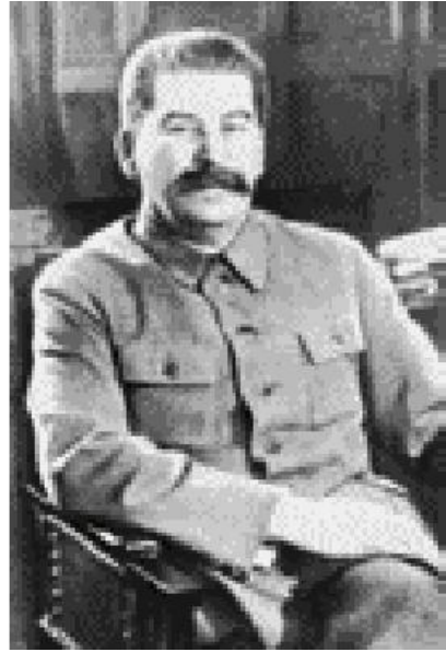
మహాసాధ్యాయుడు కా. స్టాలిన్

ఇప్పుడు, జూలై దినాల తర్వాత, “అధికారమంతా సోవియట్లకే” అన్న నినాదాన్ని బోల్షివిక్ పార్టీ ఉపసంహరించుకుంది. అంటే దీని అర్థం సోవియట్లు అధికారానికై చేసే పోరాటాన్ని విడనాడటమని కాదు. విప్లవ పోరాట సాధనాలైన అన్ని సోవియట్లను గురించినాక, మెన్షివిక్ల, సోషలిస్టు - రివల్యూషనరీల పెత్తనంలో వున్న సోవియట్లను గురించే, ఇప్పుడమలులో వున్న సోవియట్లను గురించే ఈ ప్రశ్న ఉద్భవించింది.