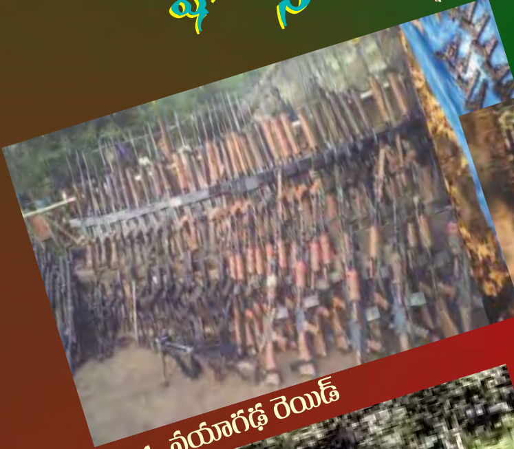
1. నీయాగిడ్ రెయిడ్