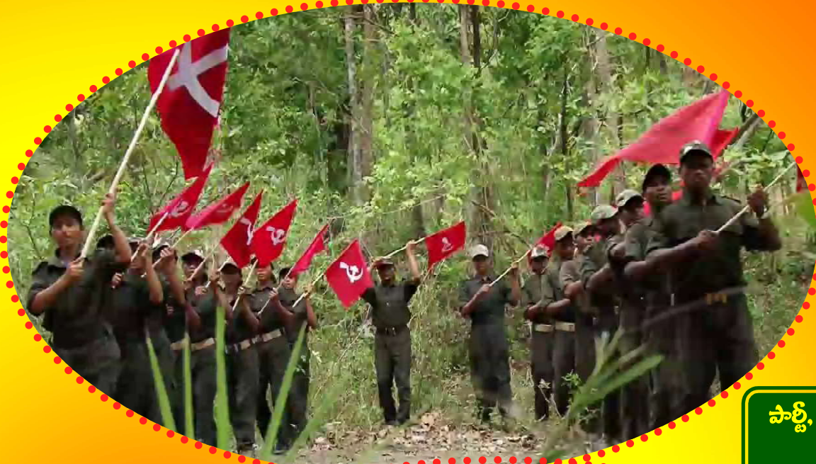
పార్టీ, పీ.ఎల్.జి.వి జెండాలతో ర్యాలీ చేస్తూ