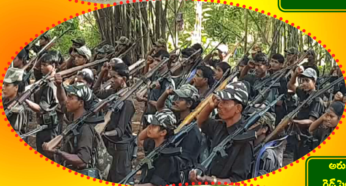
అరుణపతాకానికి రెడ్ సెల్యూట్ చేస్తూ