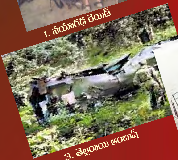
3. తెల్లరాయి ఆంబుష్