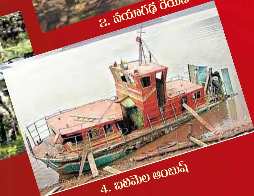
4. బలిమెల ఆంబుష్