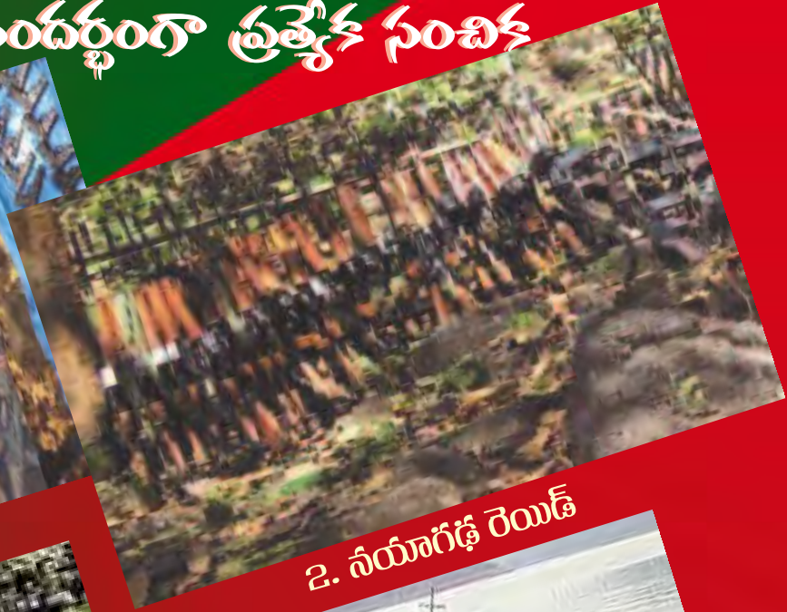
2. నీయాగిడ్ రెయిడ్