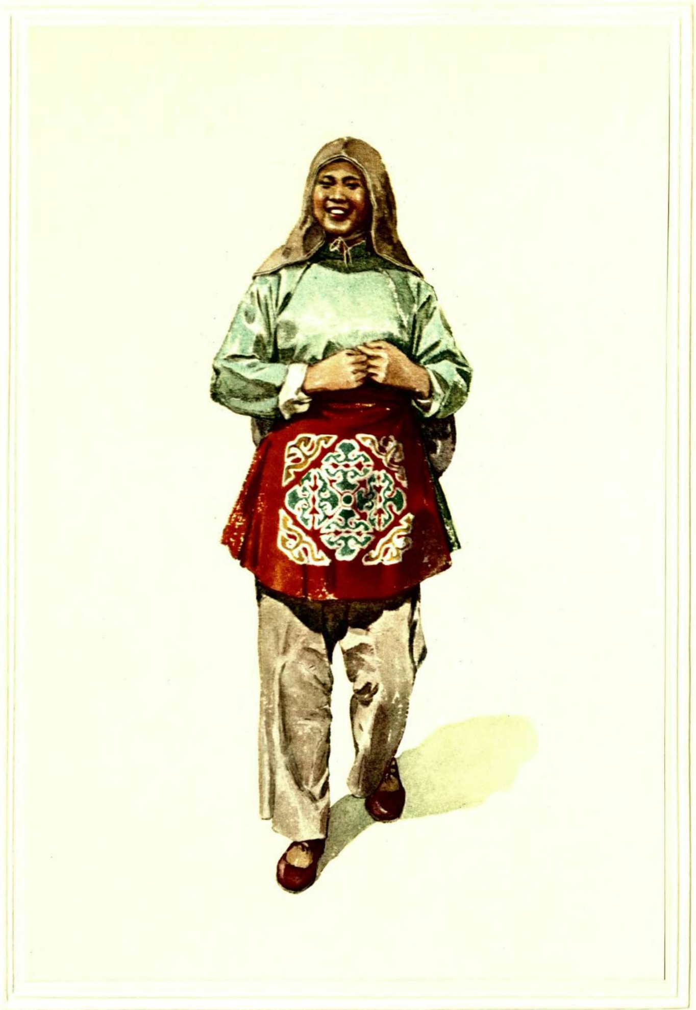
东 乡 族