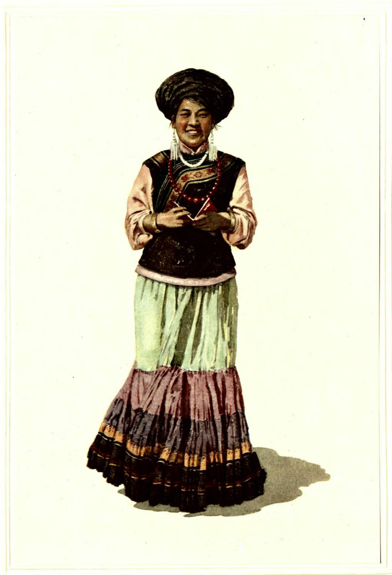
彝 族 (四川大凉山)