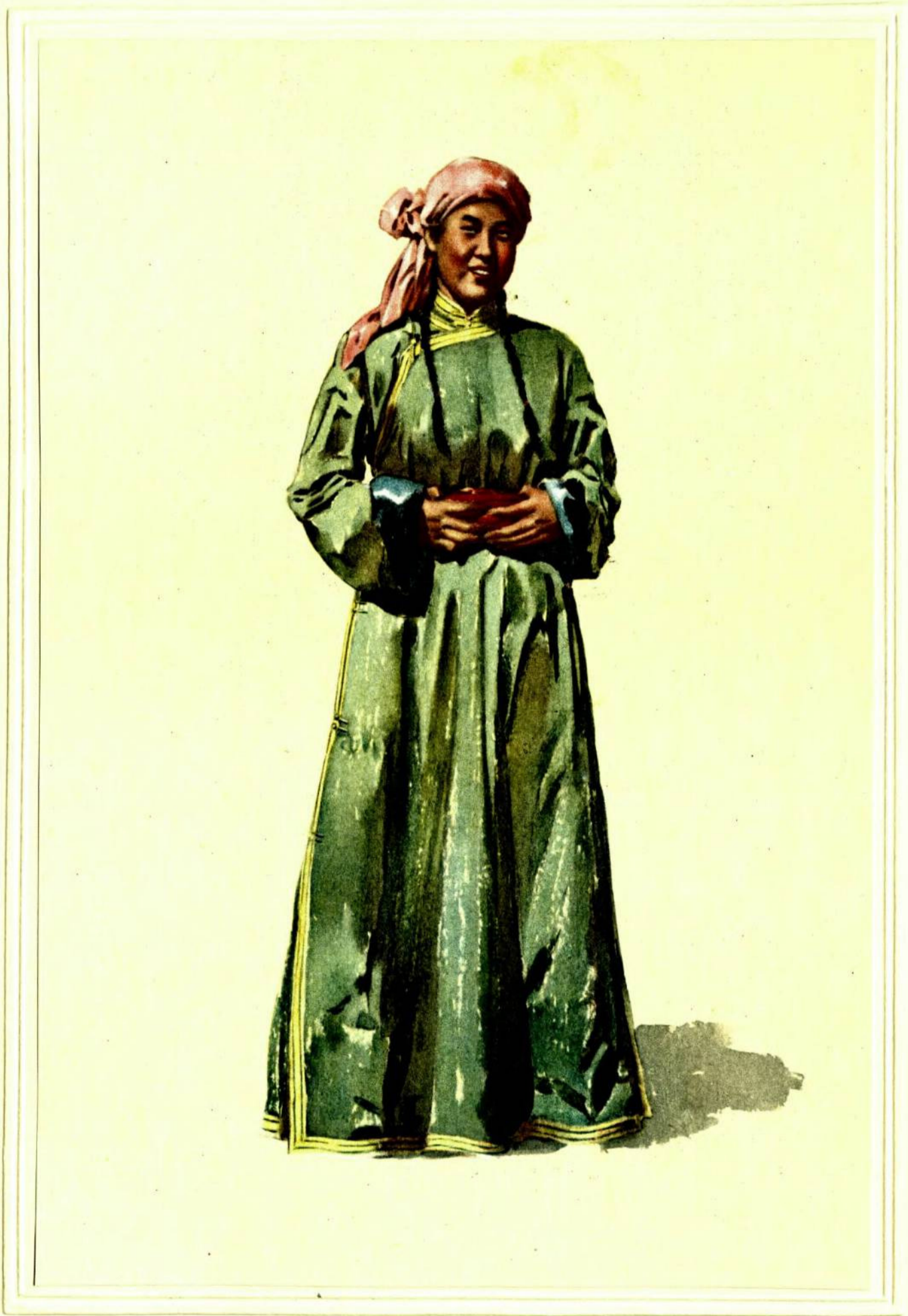
蒙 古 族