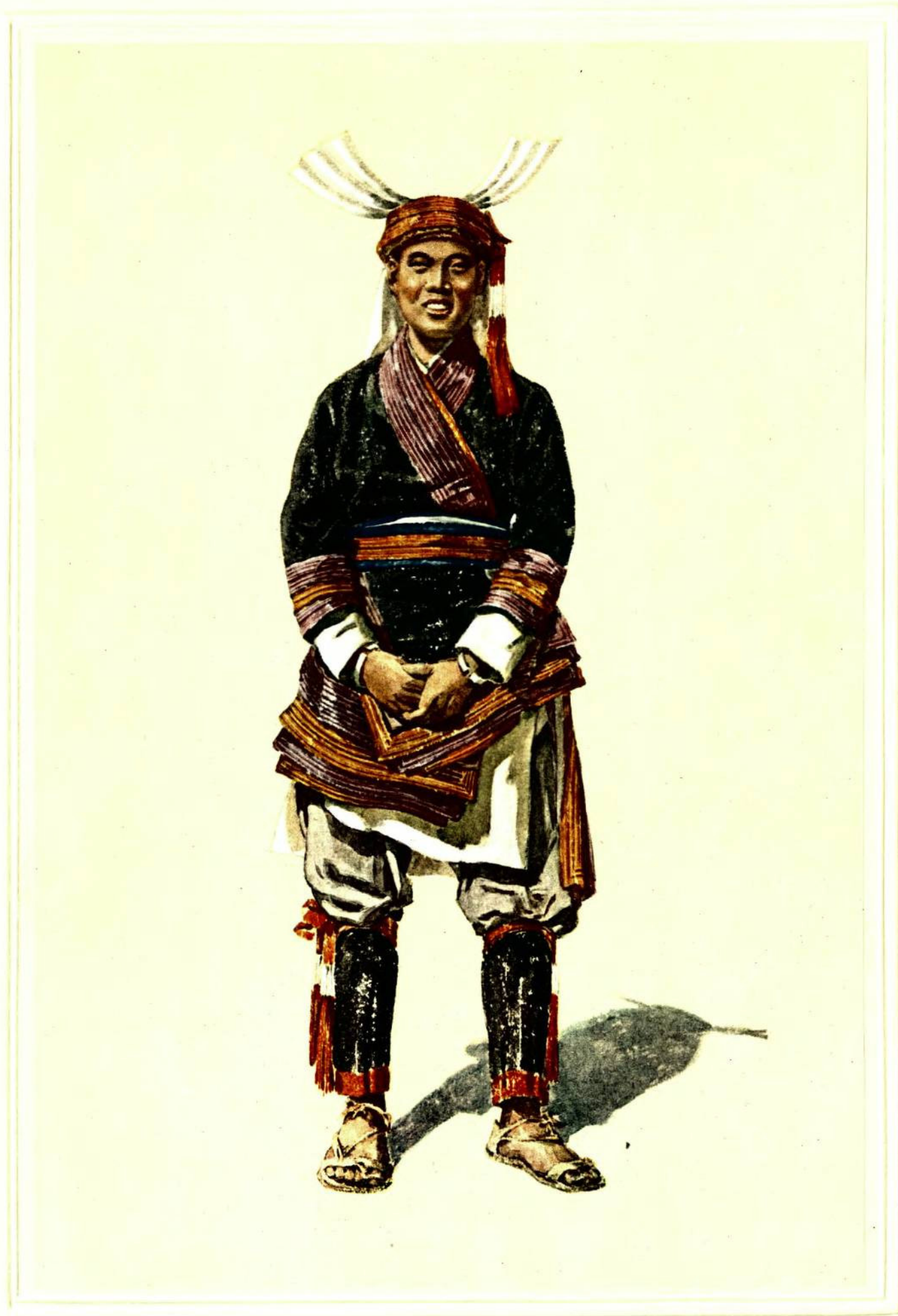
瑶 族 (广西大瑶山)