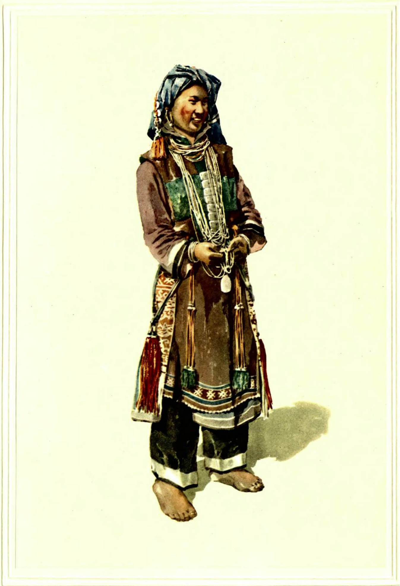
傈 傈 族