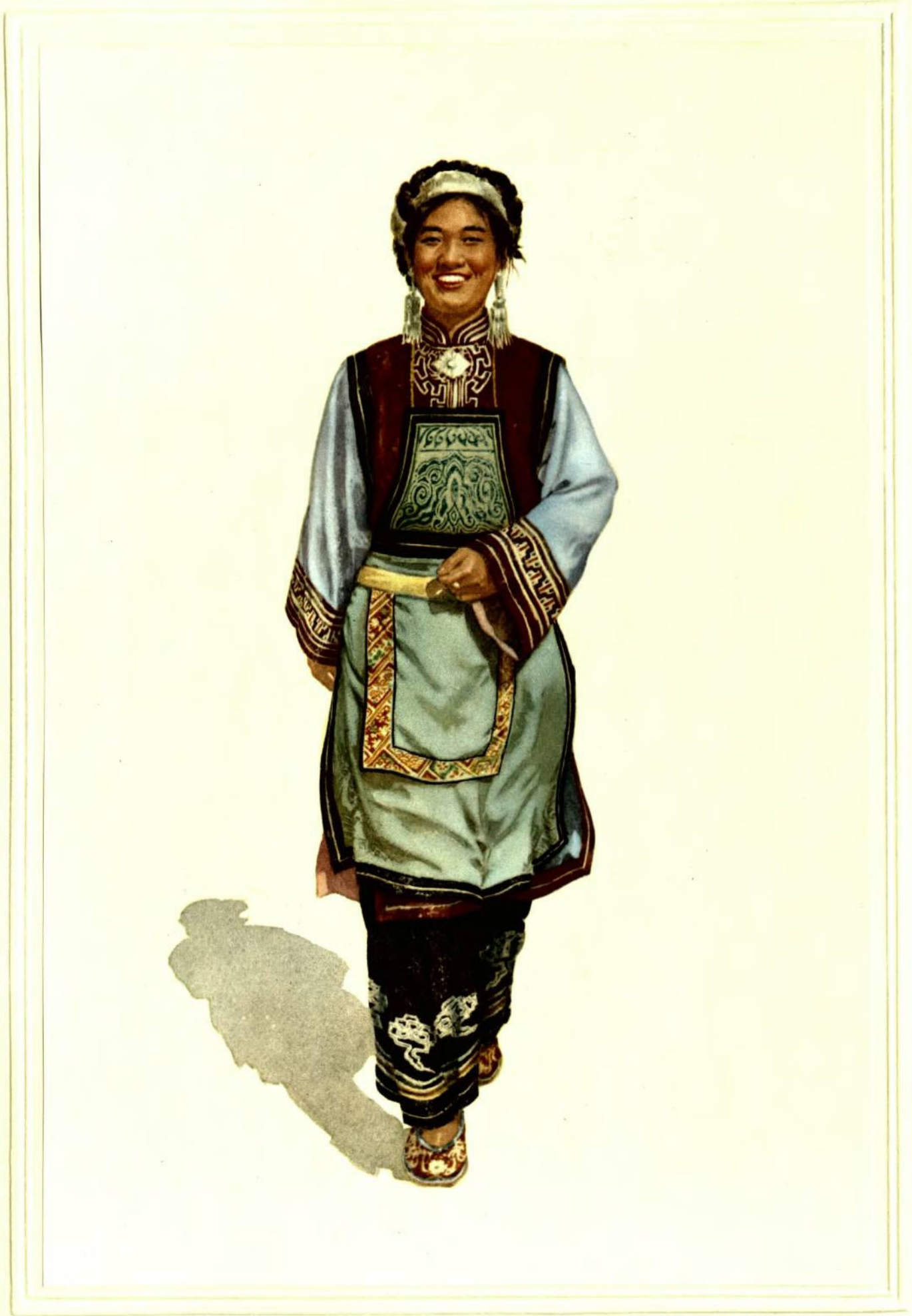
彝 族 (云南泸西县)