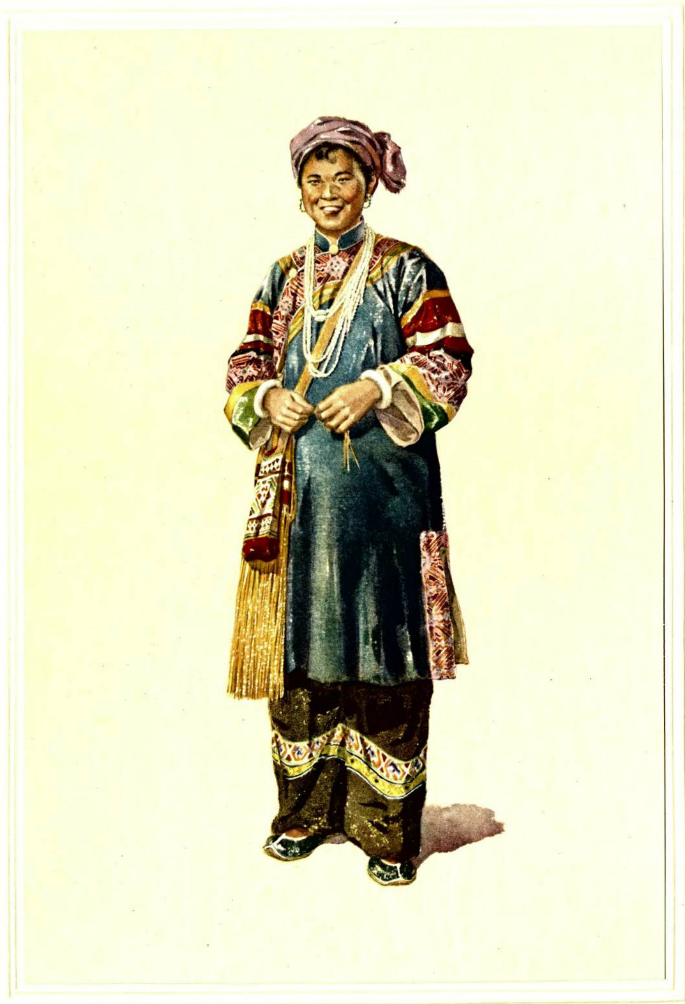
拉 祜 族